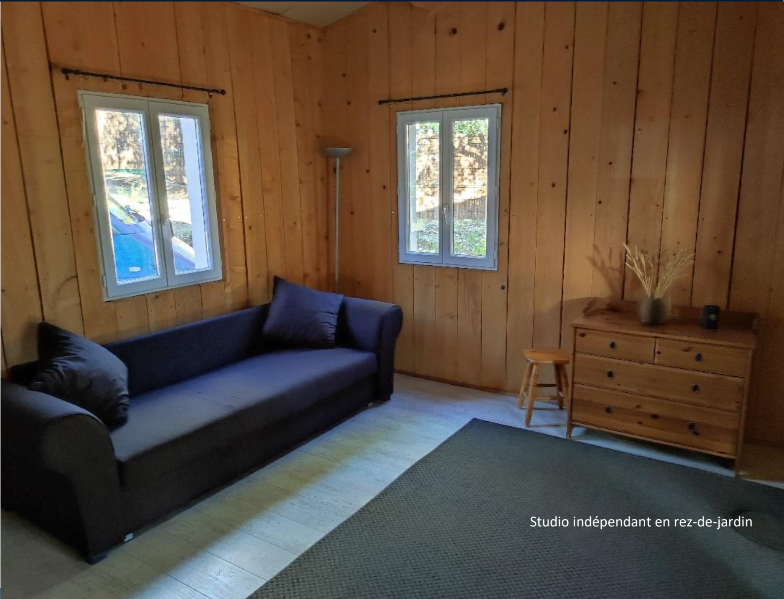
Studio indépendant en rez-de-jardin