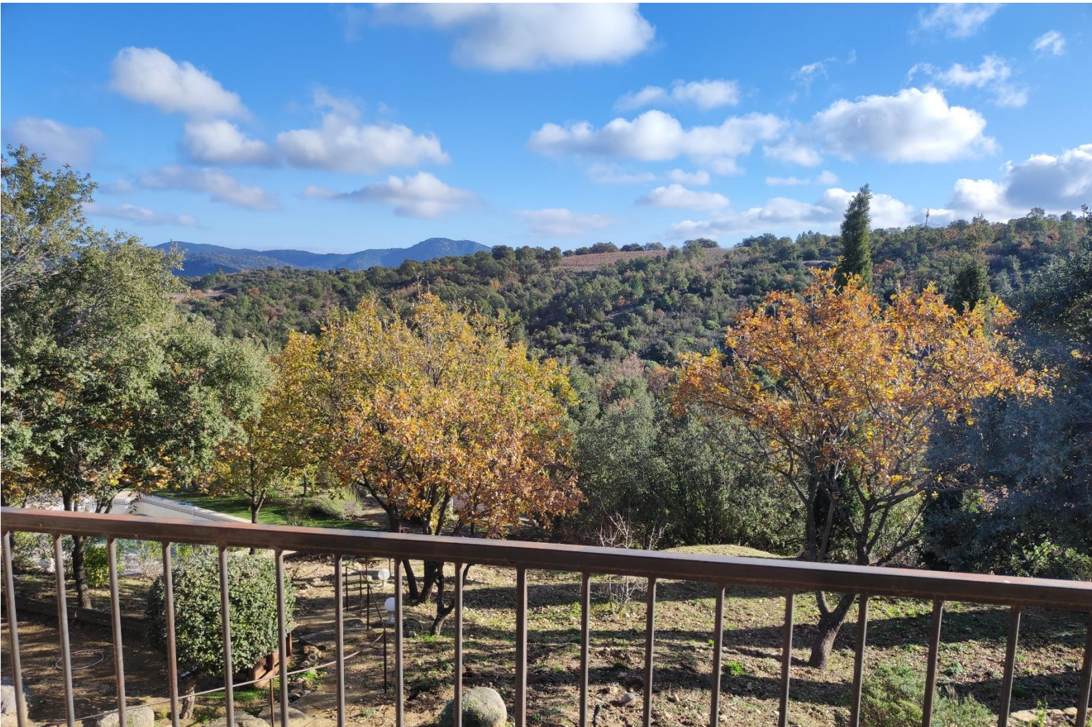
Vue sur la piscine, les chênes liège et chênes verts et oliviers depuis la chambre du premier étage